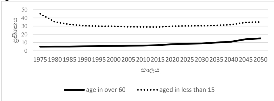
ප්‍රස්ථාරය 1: වර්ෂ 2050 වනවිට වයස්ගත ජනගහනයේ ව්‍යාප්තිය