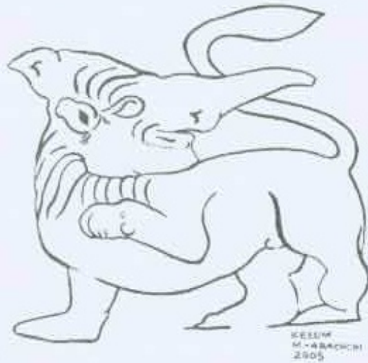
මෙහි සිංහ රූපය මිනිසාගේ සිංහ කොටුම දැක්වීමට භාවිතය.

සිංහයාගේ භාරීරික ලක්ෂණ වෙනස්වන කිරීමට අමතරව සිංහයා තවත් සත්ව හා මිනිස් රූප සමඟ මිශ්‍ර කිරීම පුරාණ කලාව තුළ දක්නට හැකි විශේෂ ලක්ෂණයකි. එමෙන් ම සිංහයාගේ අංග තවත් නිර්මාණ වෙනුවෙන් ඇතුළත් කිරීම ද සිදුවී ඇත. මකරා එයට කොඳුම් උදාහරණය වේ. මකරාට ඇත්තේ සිංහ පාදය හත් සිංහ නාඪ සිංහ, හත් නාඪ සිංහ පාදී සතට සඳා කිරීම් තුළින් සූර්‍යයා කලාකරුවා තම අදහස් සංකේතාත්මකව ඉදිරිපත් කිරීමට හෙළි ඇති බව පැහැදිලි වේ.