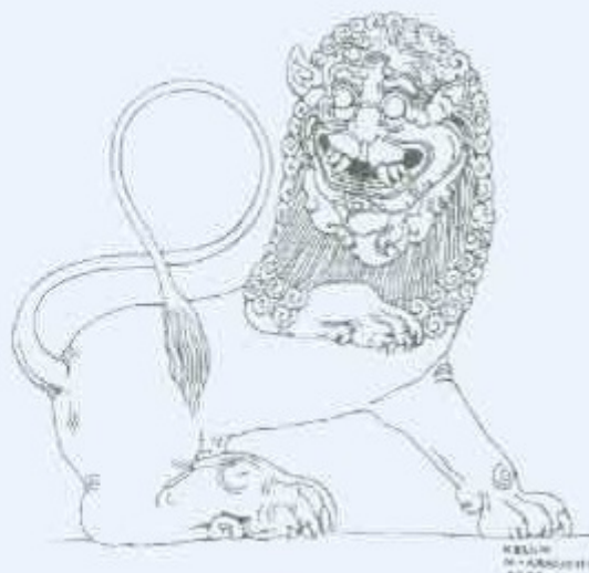
3 වන රූප සටහන සිංහ රූපයේ අතර වැඩි අතර කේසරයේ පහත වැඩි කැටයමක් (පහත අනුරාධපුරයේ අනුරාධපුරයේ කැටයම් කොට ඇත.)

රවුම් වූ ස්වරූපයක් හෙත්වයි (3 වන රූප සටහන). එහි මුහුණ වටා ම කේසර නෙළා ඇත. එමෙන් ම මිහින්තලේ සිංහ පොසුපොසු වූ සිංහ කැටයමක කේසර නෙළා ඇත්තේ යිඳුලක් ආකාරයටය (2 වන රූප සටහන). තේල්ල වටාම කේසර පිහිටීම ස්වභාවික ලක්ෂණයක් වූවත් සෑදූ සිංහයින්ගේ ජවය වඩා තොළේ. එමෙන් ම මෙම කැටයම්වල නිකට්ටු