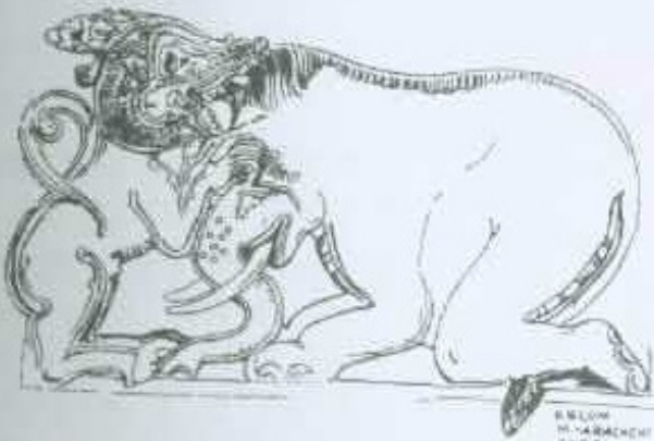
12 වන රූප සටහන ඇළ සිංහ සටහනේ ඇඳීමකින් අඩි පහේ ඉ රි කැටයමක්

සාහේ මුඛය විවෘතව ඇති අතර එයින් ලියවූලක් විහිදෙයි. හොහෝ දුරට එක් සාදයක් මිසවා ගෙන සිටියි. වල්ගය මතා ලෙස හැඩගන්වා ඇති අතර ලිංගෝද්දිය පැහැදිලි ය.