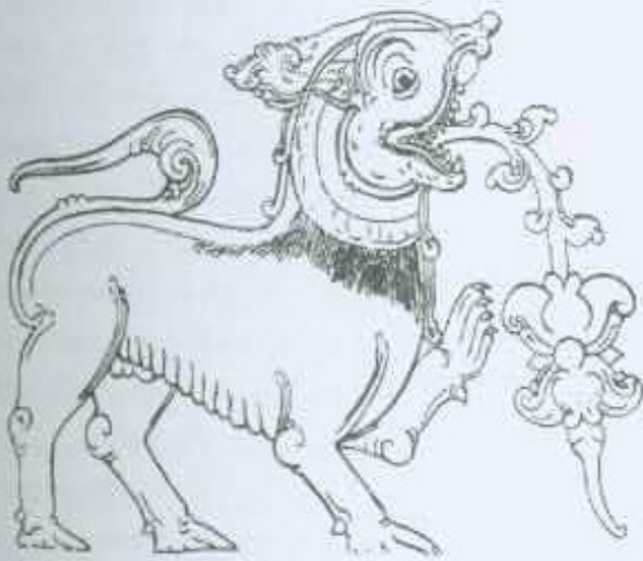
KELUM M. 454CHN 2005

දක්වා ඇත (5 හා 11 වන රූප සටහන්). තවුන් ජිනිත්තලේ සිංහ පොසුණේ වූ සිංහයාගේ ලිංගෝත්සව දක්වා නැත (4 වන රූප සටහන). ලිංගෝත්සව සෑහූ සිංහයෙකුගේ ලිංගෝත්සව වඩා මනුෂ්‍ය ලිංගෝත්සවක හැඩයක් ආරූඪ කොට ඇත.