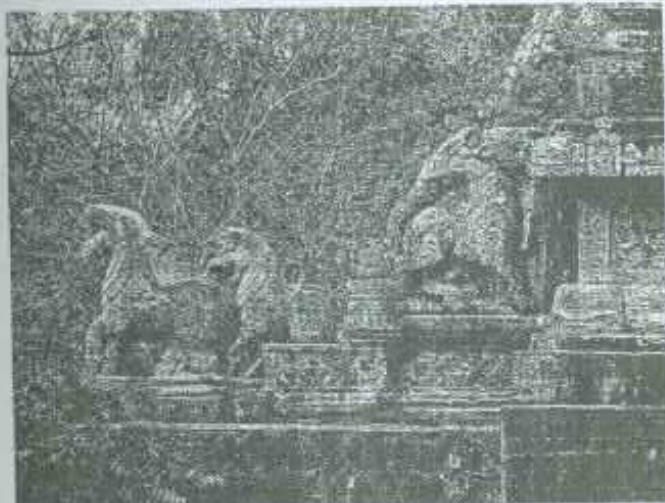
1 සිංහ ස්ථම්භය ක්‍රි.පූ. 3 වන සියවසේ සිංහලයේ සිටින රජුන්ගේ ස්මාරකයක්.