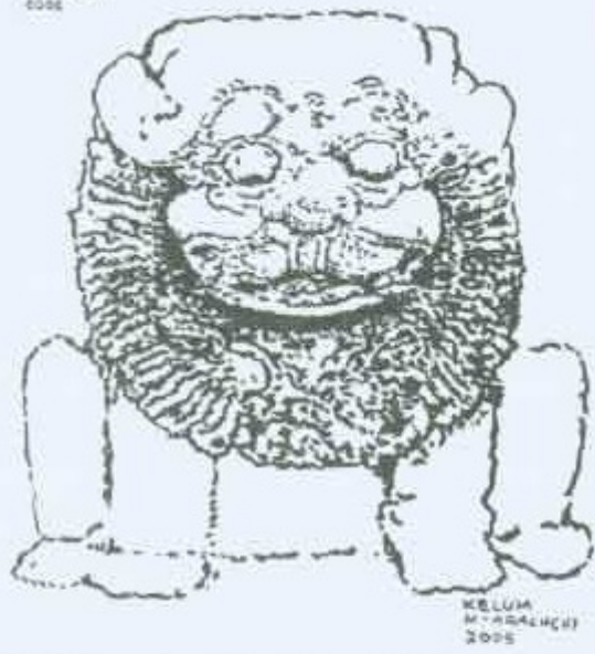
4 වන රූප සටහන සිංහ රූපයේ මිහින්තලේ සිංහ පොසුපොසු වූ කැටයමක්.

වූ කේසර අනෙක් කේසරවලට වඩා වෙනස් ආකාරයට නෙළා ඇත. මේ කොටස නිසා මුහුණ විශාලත්වයෙන් (3 වන රූප සටහන), මහනුවර දූතයන් ලී කැටයම් හා බිත්ති මිටුවල වූ සිංහයින්ගේ කේසර ඉතා කෙටි හා ක්‍රමානුකූලව දක්වා ඇත. ඒවා ග්වර කිහිපයකට දක්වා ඇත (7, 8 හා 12 වන රූප සටහන්).