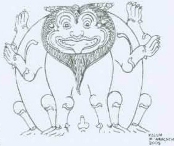
11 වන රූප සටහන අළුතර සිංහ රූපයේ රිදී විහාරයේ පිටුපස සිත්කමේ (කුටුම්භය)

රිදී විහාරයේ බිත්ති සිත්කම් අතර පිදි ඉරියව්වෙන් ඉදිරිය බලා සිටින සිංහ රූපය (11 වන රූප සටහන) පිළිබඳව විශේෂ සඳහනක් සිරිමි අතපව්ගාය ය. මුඛය මදක් විවෘත කර දිව අර්ධ ලෙස පිටතට යොමා ගෙන සිටියි. මනිස කායය පැහැදිලි ය. කේසර සාදු ය. ඒවා බෝසකක හැඩයට ක්‍රමානුකූලව හැඩ ගන්වා ඇත. හිසේ ඉහළ පු කේසර දැවැන්තවත් සමමිතිකව දෙසට විහිදවා ඇත. මිසවාගෙන සිටින ගාත්‍ර) යුගල් දෙකකි. බිම ස්පර්ශ කරන එක් ගාත්‍රා යුගලක් ද රිටි පිටුපසින් තවත් ගාත්‍රා යුගල් දෙකක් ද පිහිටියි. මනිස හැඩැති ලිංගය පැහැදිලිව දක්වා ඇත. මේ මුහුණ කරමක් දුරට විසට ස්වරූපයක් ගනියි.