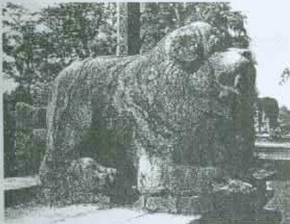
12 වන රූප සටහන පුෂ්පා සිංහ රූපයක නාසයක්

දුර්විද්‍ය බලා පිටින සිංහයින්ගේ (ගල් කැටයම්වල හෝ ලී කැටයම්වල හෝ බිත්තිවල හෝ ඇඳි චිත්‍රවල) නාසය සිංහ